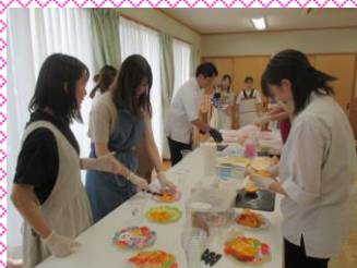
9/1/5 きゅうとごぶんのいちスイーツ作り