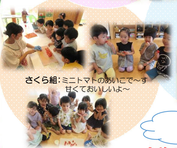
さくら組: ミニトマトのあいこで~す 甘くておいしいよ~

栄養素が詰まった夏野菜は夏バテ防止にも効果がある食材です。水分やカリウムを多く含む体の熱をクールダウンする役目があり、不足しがちな栄養素を簡単に補給できるんですよ。