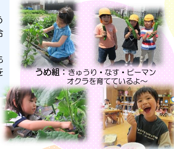
うめ組: きゅうり・なす・ピーマン オクラを育てているよ~