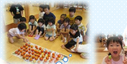
もも組: トマトのりりこは リコピンが入って栄養満点!