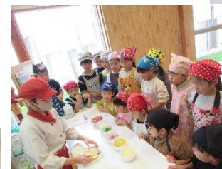
好きな材料をトッピング