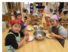
トマトの皮むいて!