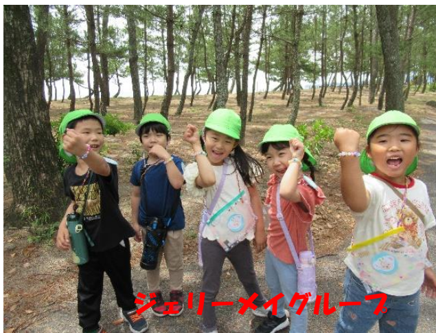
ジェリーメイグループ