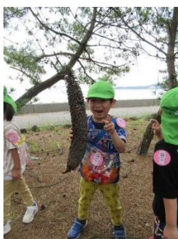
大きなまつぼっくりみつけ!