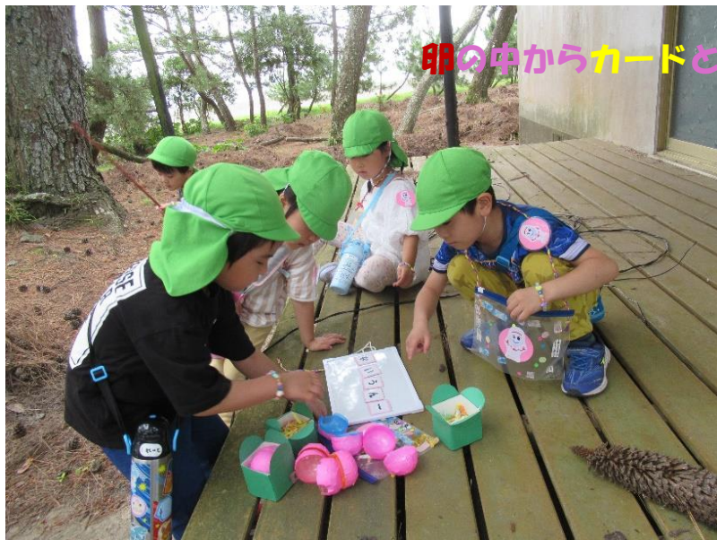
卵の中からカードと宝物