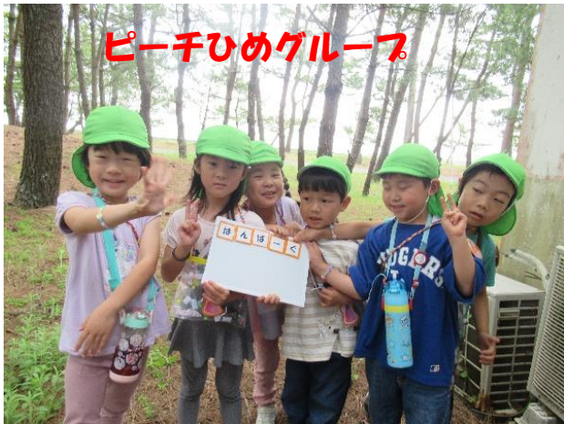
ピーチひめグループ