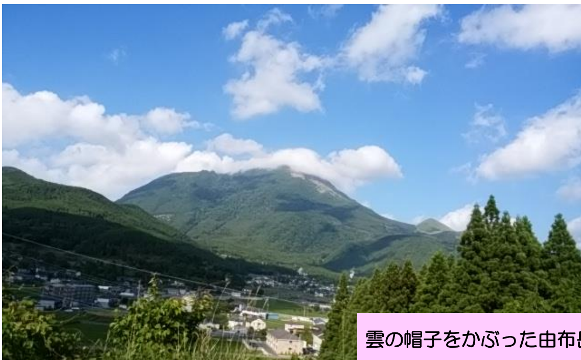
雲の帽子をかぶった由布岳