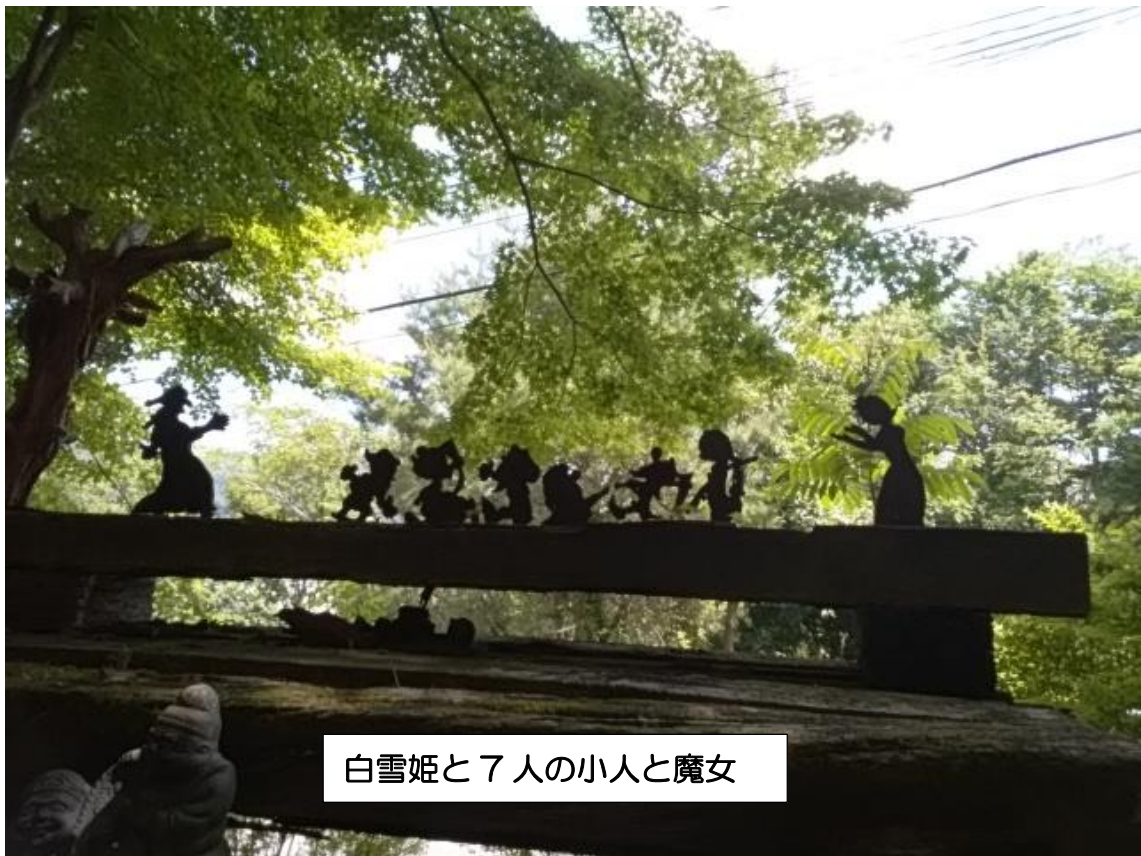
白雪姫と7人の小人と魔女