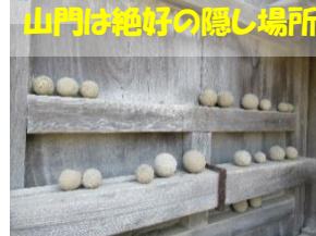
山門は絶好の隠れ場所