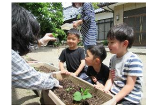
枝豆、すごいね! 根っこがなが〜くのびてま〜す!