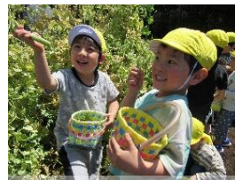
お米と一緒に炊きました