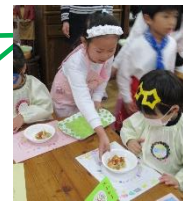
チーズ、玉ねぎ等トッピング