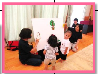
RUMI mama 教室