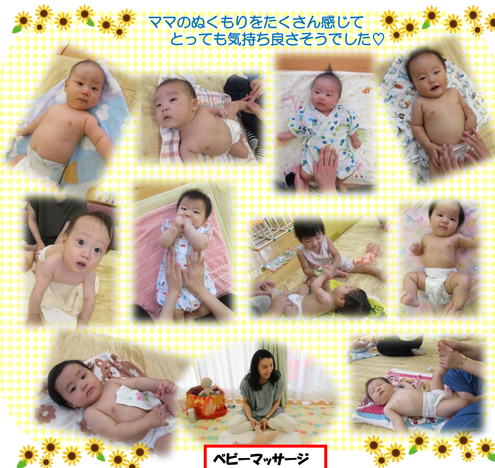
ベビーマッサージ