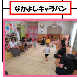
なかよしキャラバン

●ベビーマッサージ…0才児(10組) (要予約) 持バスタオル ※電話でのご予約は開所時間の 10:00~15:00 でお願ひします。 ◎ 暑い8月はゆっくり過ごしましょうね！