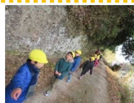
歩いて行って知恵もちをもらったよ

豆まきで、泣き虫鬼、おこりんぼ鬼、いじわる鬼、病気の鬼、弱虫鬼を「おには外！」と追っ払って「ふくは内！」と呼び込み、みんなで豆まきをして、身体の中に住んでいる悪い鬼（みんなの身体の中にはいないかもね）を追い出しましょう。園では2月2日(金)に行います。