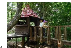
魔女からのてがみ