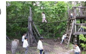
アスレチックあそび