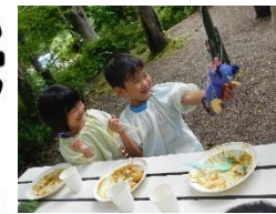
カレーのおかわり