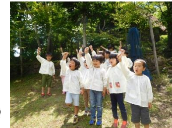
「勇気のしるし」をもらったよ