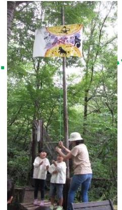
園の旗をあげました