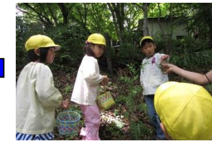
野草をつんで、天ぷらに！