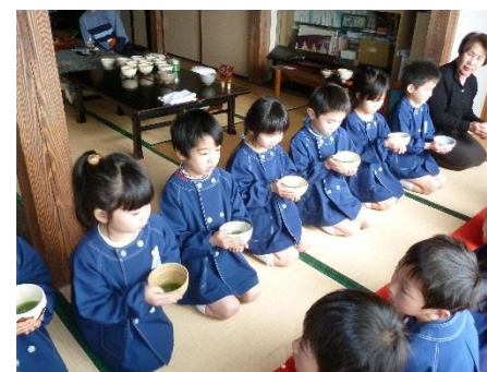
お点前、お運びも上手になりました

グラビア撮影、取材無事に終わりました。あいにくの雨でしたが、子どもたちの表情を撮影するのは、さすがプロだな〜と思いました。各クラスの部屋をまわりながら子どもたちの姿や笑顔をキャッチしていました。どのように保育園を紹介していただけるのか、いまからとても楽しみです。また、ご報告いたします。